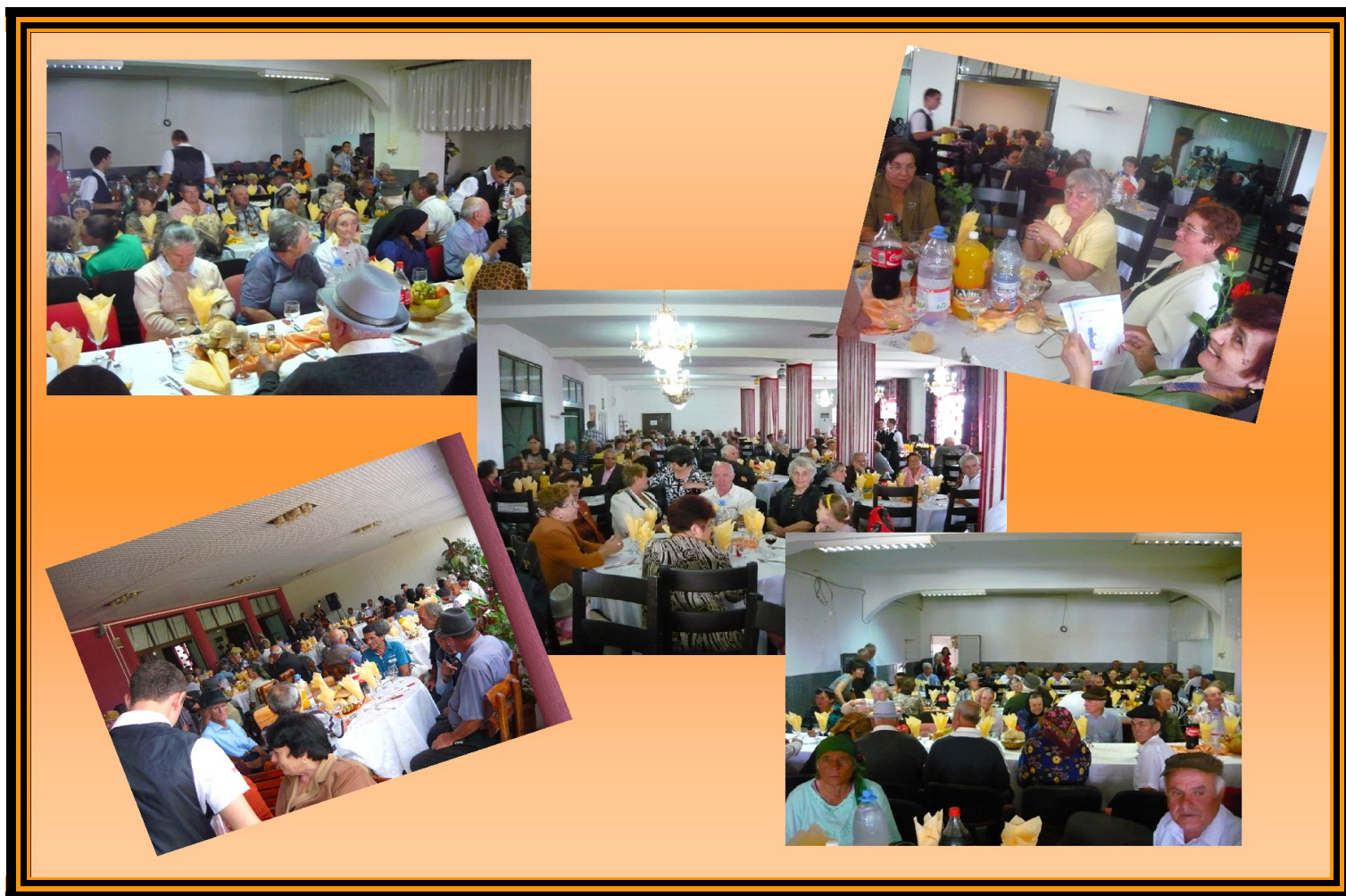
Reîntregirea marii familii a pensionarilor videleni