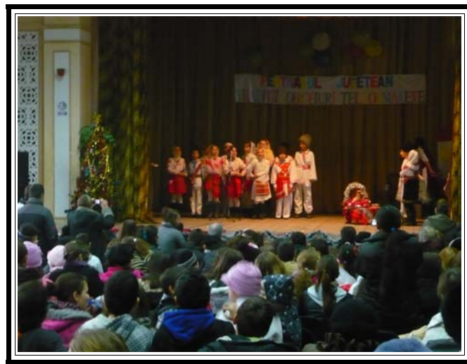
Și din nou ...Colinde