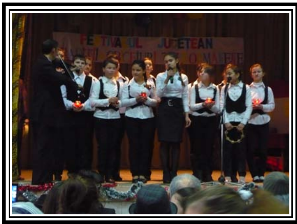
Colinde moderne acompaniate