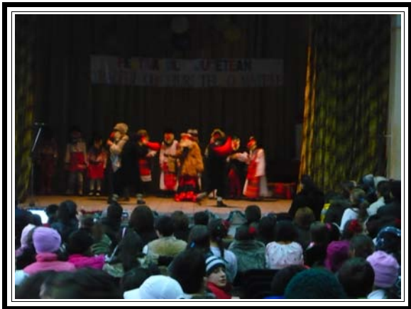
" Ursul "