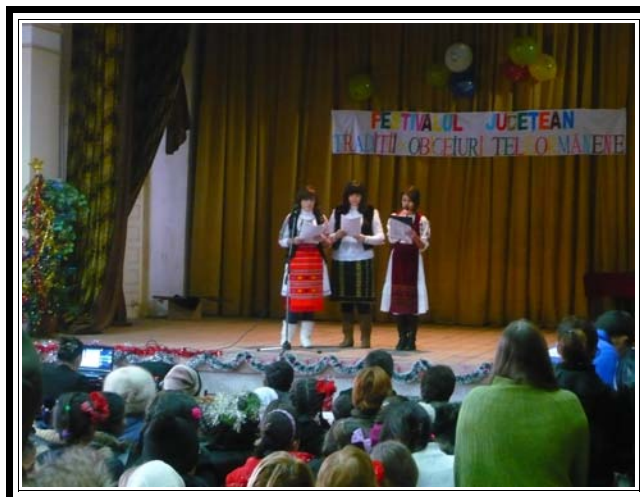
Prezentarea spectacolului de către copii