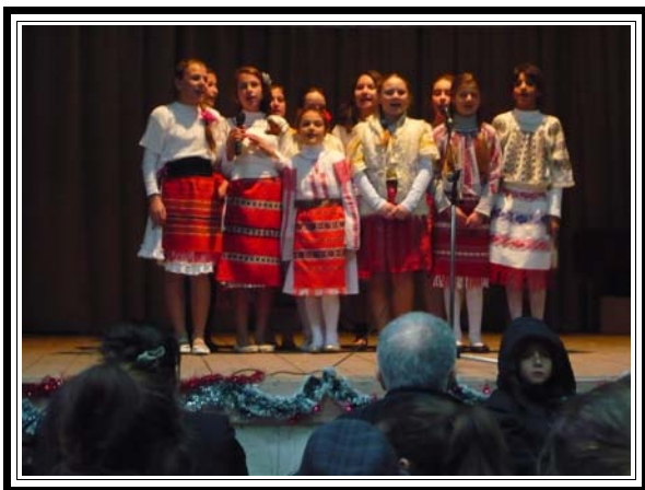
Colinde și urări