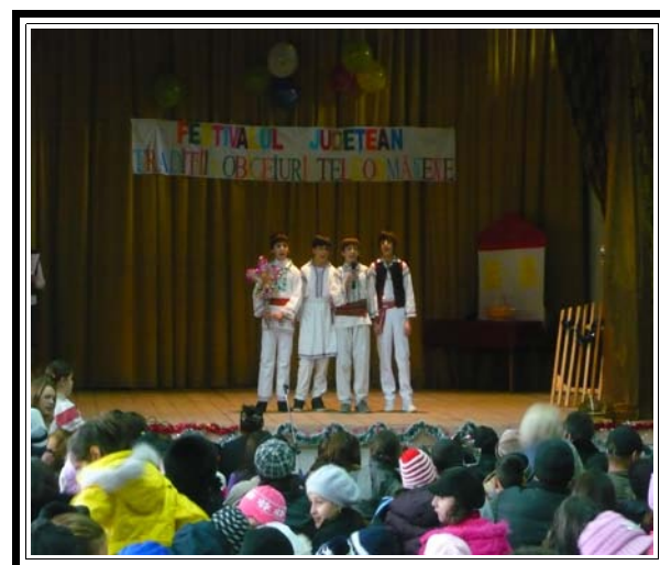
" Steaua "