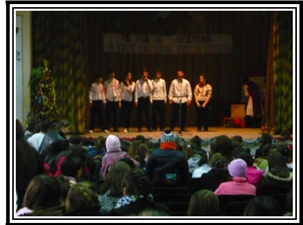
Colinde moderne și "Reloiul"