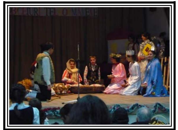
" Irodul "