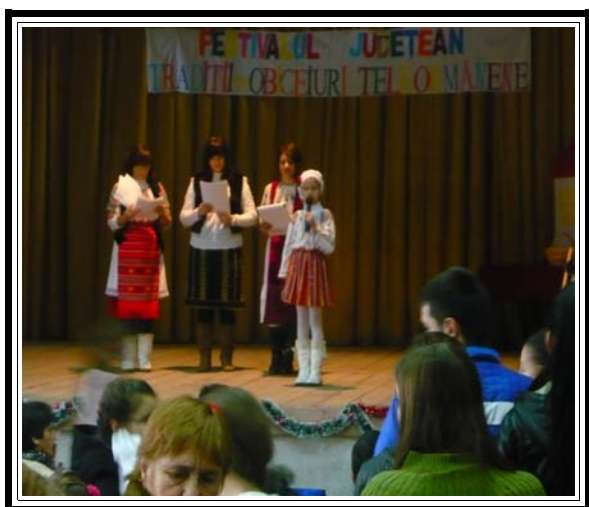
Poezii dedicate Crăciunului